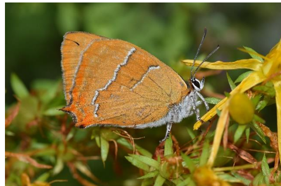
Abbildung 2: Nierenfleck-Zipfelfalter – im Rosengarten bei Gundersheim Rosengarten am 10.8.2014

Die Flügelunterseite ist bei beiden Geschlechtern einheitlich hellbraun mit orangen Querbändern. Die Bänder werden von weißen gezackten Linien begrenzt. An den Hinterflügeln befinden sich die orangen, dunkelbraun begrenzten Zipfel.