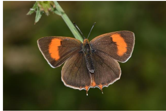
Abbildung 1: Weibchen des Nierenfleck-Zipfelfalters am 14.7.2022 in Bingen-Dromersheim

Die Flügeloberseite des Falters ist braun und eigentlich nie zu sehen. Bei den Weibchen befinden sich zwei namensgebende nierenförmig angeordnete orange Flecken auf den Vorderflügeln. Bei den Männchen fehlen diese Flecken.